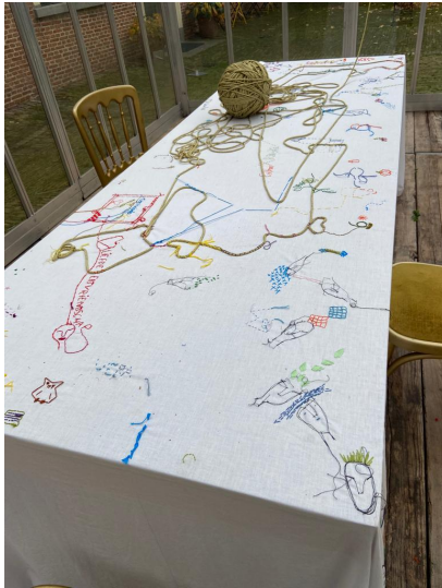
Afbeelding 1