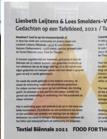
Afbeelding 3, foto: Sonja Moenen